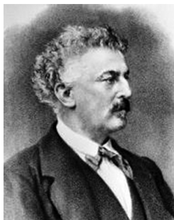
П. А. Чихачёв, 70-е годы, XIX век

здесь и прикочёвывают на лето к Оренбургской линии между Орска и Верхнеуральска. Ныне же насилие это вошло в употребление, и наши так называемые подданные (киргиз-кайсаки), будучи с нашей стороны освобождены от всякой подати и в тоже время подвергаясь по беззащитности своей всем произвольным притеснениям и поборам хивинцев, поневоле повинуются им более, чем нам, и считают себя более или менее подведомственными хивинскому хану».