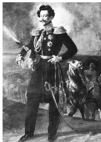
В. А. Перовский, портрет работы К. Брюллова, Третьяковская галерея

Приведу отрывок из донесения Виткевича оренбургскому губернатору: «Ныне власть и влияние нашего управления простирается почти не далее пограничной черты Урала и не внушает ни кайсакам, ни областям Средней Азии особенного уважения. С нашего каравана взято хивинцами с одних бухарцев на 340 бухарских червонцев, или на 5440 рублей. С татар наших берут, как известно, вдвое против азиатцев... У татар наших развязывают тюки, бьют людей и собирают с неслыханными притеснениями и злоупотреблениями; из развязанных тюков хватают и ташат товары во все стороны... Если согласишься своими глазами на эти самоуправства, о коих у нас едва ли кто имеет понятие, то нисколько нельзя удивляться застою нашей азиатской торговли. Хивинцы ездят по Сырдарье до самого Ак-Мечета Ташкентского, где отделяется Куван от Сыра, и грабят беспощадно чумекейцев наших, которые зимуют