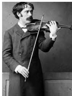
Пабло де Сарасате

Однако наибольшую популярность опере, начиная с конца XIX века и по наши дни, принес жанр транскрипции. Композиторов так вдохновляла музыка оперы, что они делали переложения для различных инструментов, используя наиболее популярные темы из нее и тем самым позволяя исполнителям на сольных инструментах играть их более часто и на более широких концертных площадках.